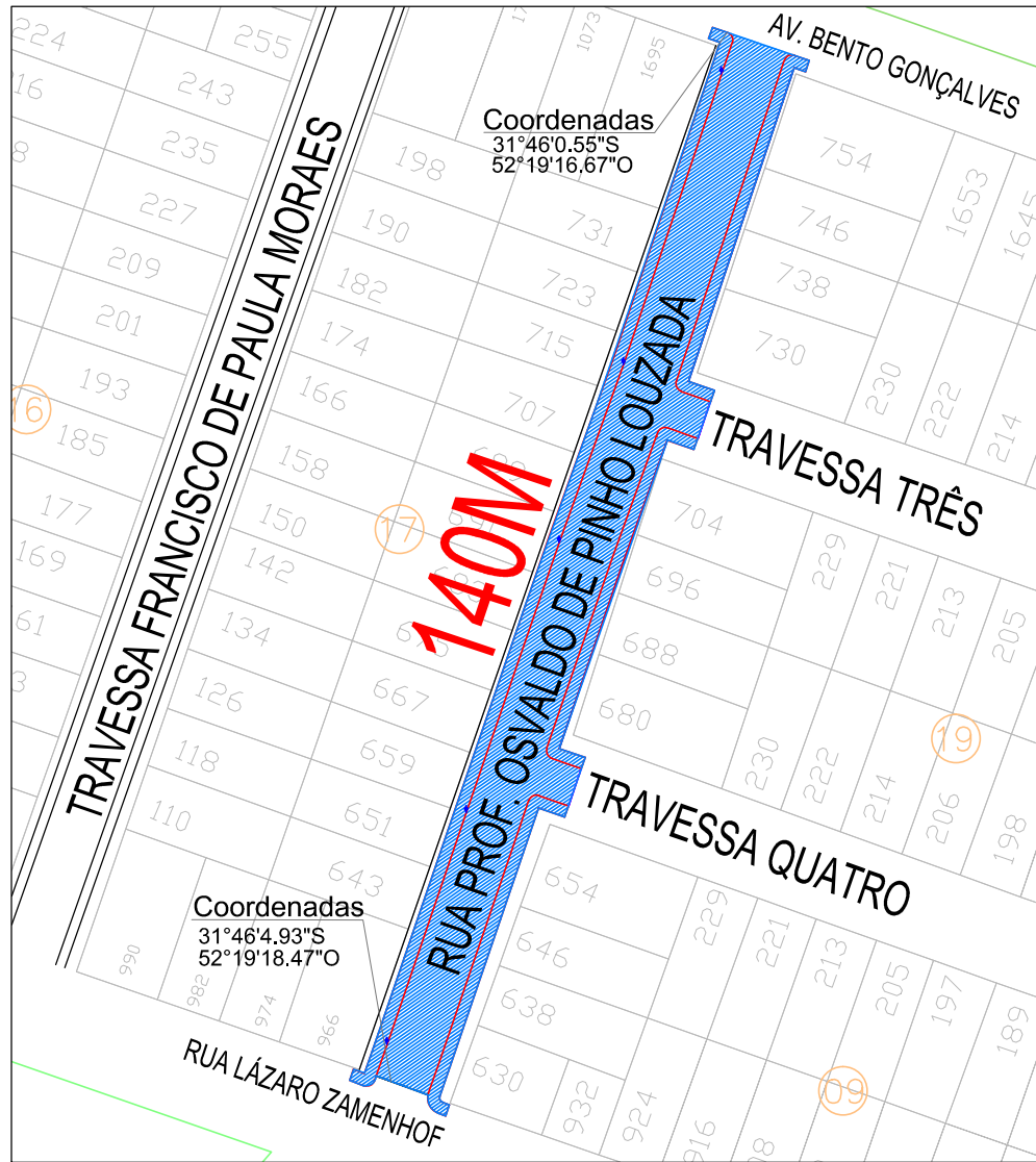
01 PLANTA DE SITUAÇÃO ESCALA 1:1000